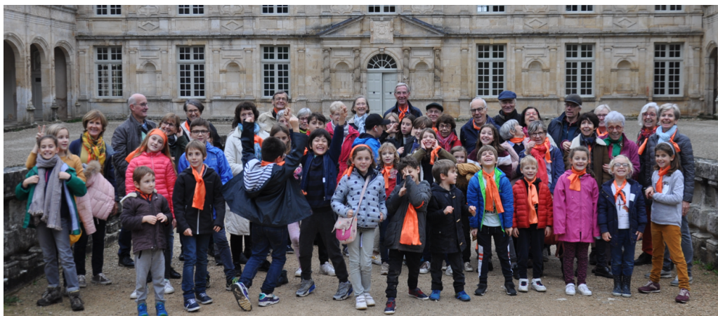
Groupe EGPE Lyon devant le château de Bussy Rabutin

Centre Berthelot, 14, avenue Berthelot 69007 Lyon 06 69 58 72 93 egpe lyon@free.fr