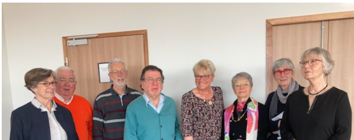
Le nouveau Président et son équipe