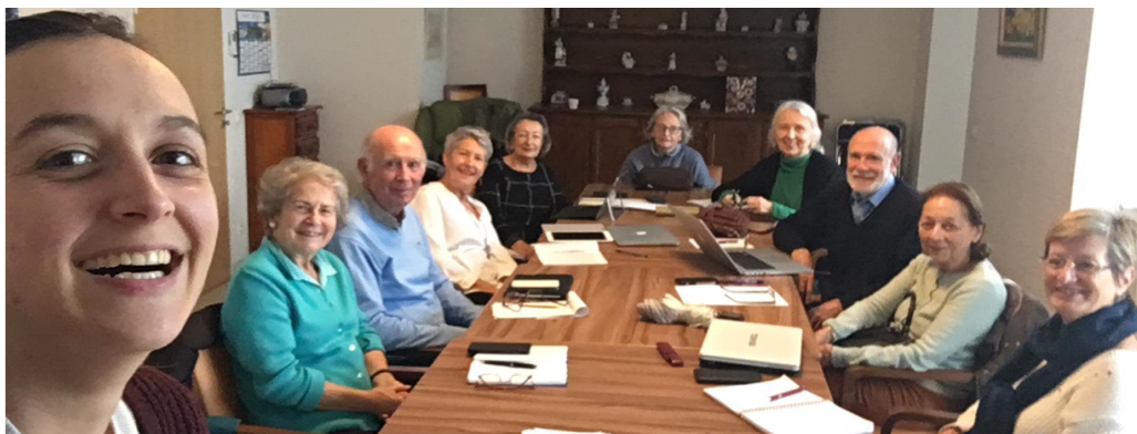
L'Atelier seniors et connectés

EGPE BORDEAUX- GIRONDE 22, rue d'Alzon 33000 Bordeaux 07 82 14 96 94 egpe33@gmail.com