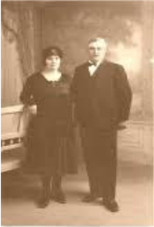
Grands Parents née en 1887 né en 1879