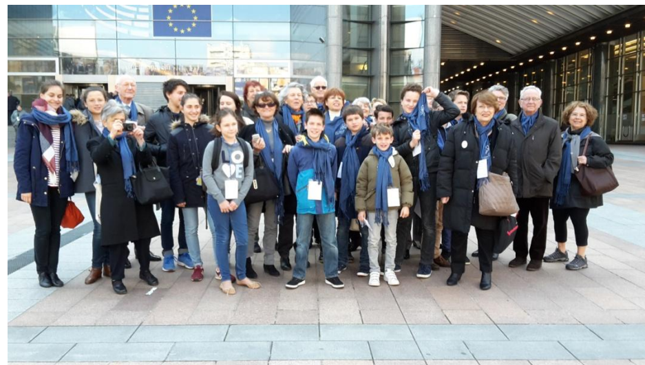
Notre Groupe (33 personnes)