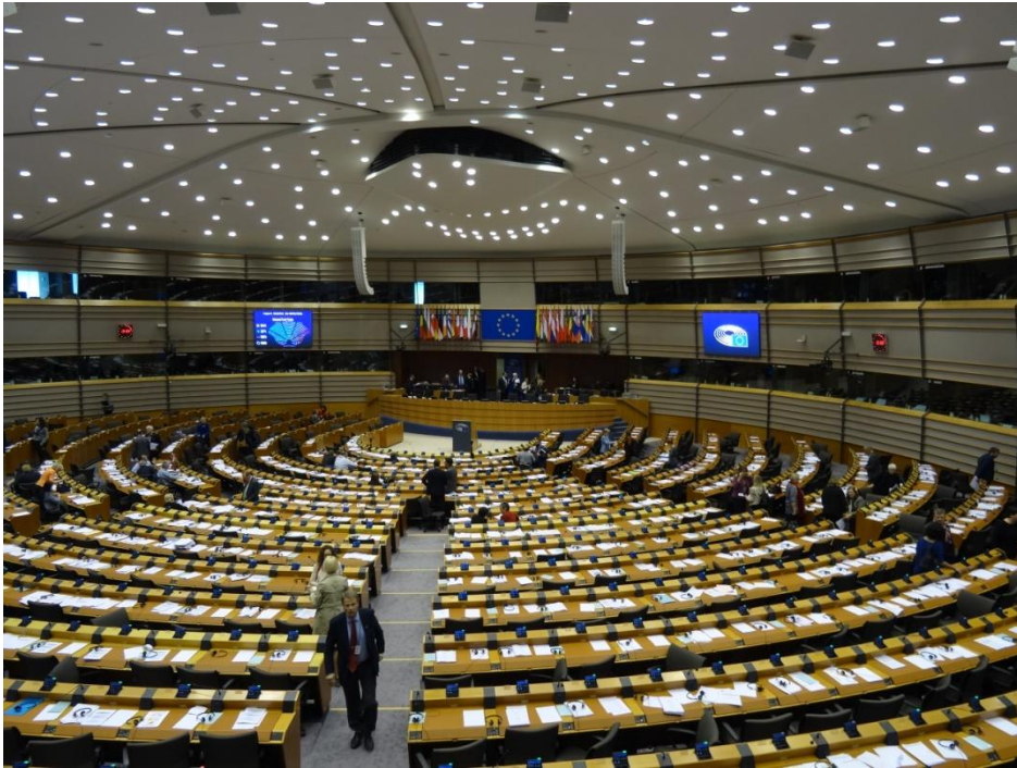
SALLE DE LA SEANCE PLENIERE PARLEMENT EUROPEEN - BRUXELLES