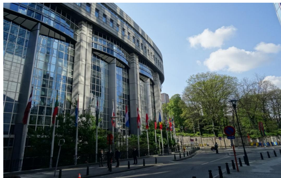
Le Bâtiment du Parlement Européen

« Le voyage à Bruxelles était génial ! Les différents endroits que nous avons visités nous ont appris des choses, comme à la RTBF ou au Musée de la BD. Cela m'a amusé de prendre le tramway bruxellois car nous n'avions pas eu de taxi. Entre-temps, j'ai rencontré des personnes très sympas avec lesquelles je me suis beaucoup amusé. Et pour finir, le dernier jour, au Parlement Européen, j'ai appris comment était construite l'Union Européenne, par qui elle était dirigée et comment elle était organisée. Bref, deux jours superbes !